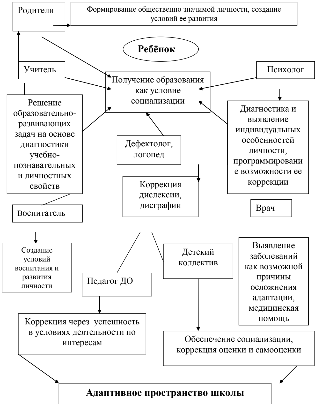
Схема психолого-педагогического и медико-социального сопровождения детей со специальными потребностями.